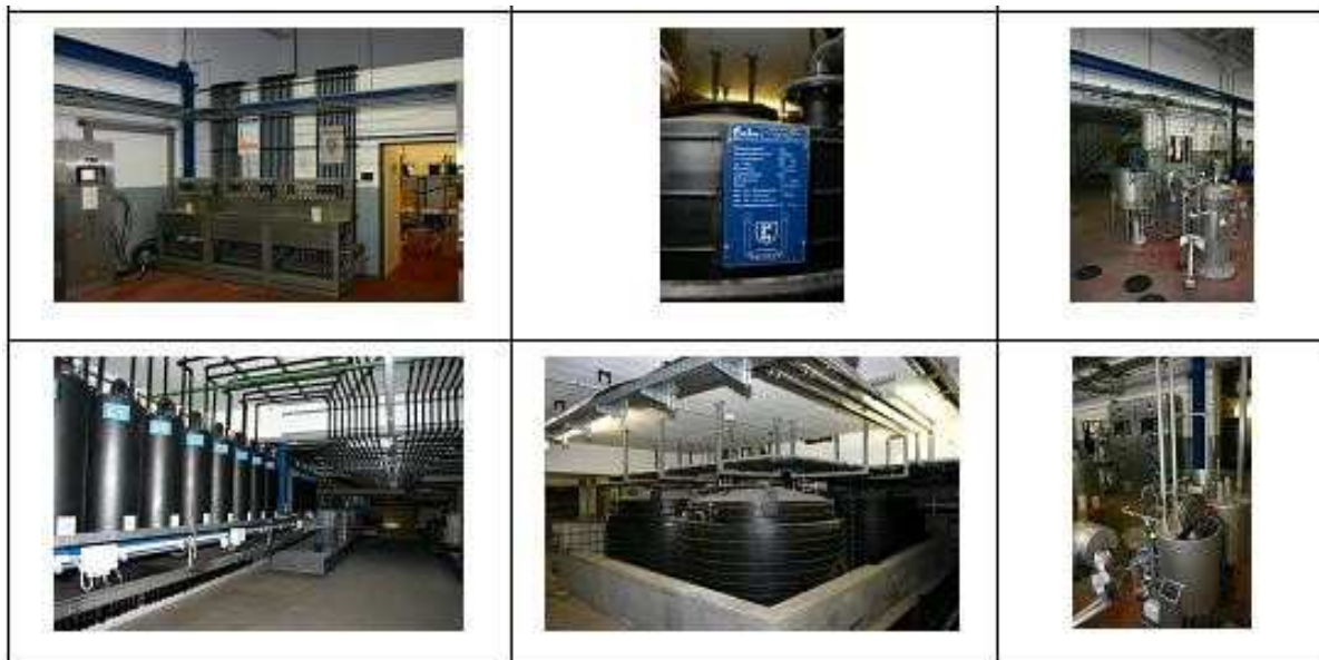
Figura 1: El uso de NaOH en la industria textil actual es en sistema cerrado sin exposición de los trabajadores (izquierda: distribución de NaOH, centro; almacenamiento de NaOH, derecha: uso de NaOH (teñido))

aerosol. Una medición de uso abierto para KOH, que es muy similar a NaOH (la limpieza de maquinaria que implica una posible exposición), mostró menos de 0,06 mg/m 3 y ese fue el límite de detección.